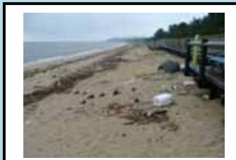
島尾・松田江浜(9月24日) 多いゴミ : 漁具、食用容器 約1700個/100㎡