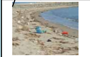
海老江海岸(9月10日) 多いゴミ: 木炭、ガラス破片 約184個/100㎡