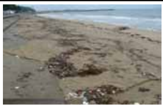
松太枝浜(9月5日) 多いゴミ: 発泡スチロール類 約374個/100㎡