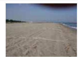
岩瀬海岸(9月9日) 多いゴミ: ペットボトル、缶 約343個/100㎡

海岸にはバーベキューやキャンプ、海水浴のあと捨てられたと考えられるゴミ以外にも、漁師さんが捨てていったゴミ、川から海に流れ出て漂着したゴミなどがたくさんあり、海水浴シーズンにはきれいだった海岸も、すぐにたくさんのゴミが溜まっていきます。