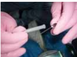
医療系ごみ(注射針)