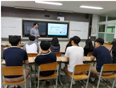
BlueCarbon онолын боловсрол сургалт