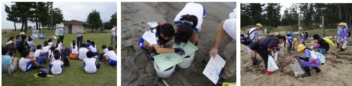
Далайн эрэг дээр хөвж ирсэн хог хаягдлын судалгааны ажил (Тояма Аймаг)