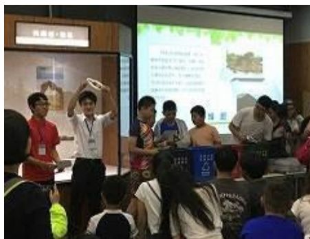
Хог хаягдыг хуваах Quiz тэмцээн