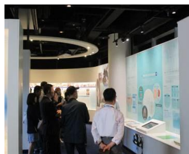
Itai-Itai өвчин музей байдал