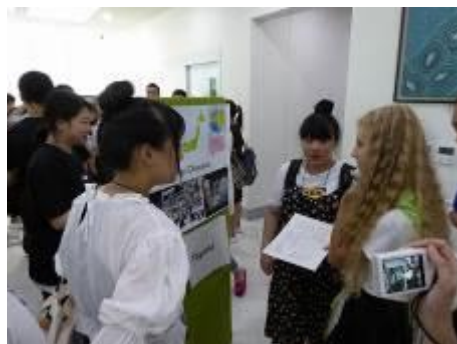
Зурагт хуудас хуралдаан