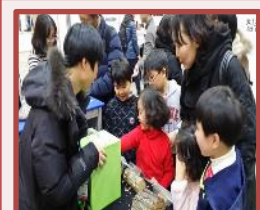
大韩民国教育博览会