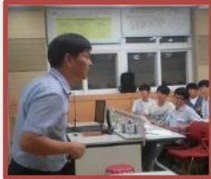
大学教授召开的生态 环境讲座