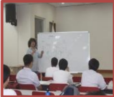
植物细密画 (Botanical Arts) 的教育