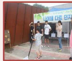
森林体验项目的志愿 者活动