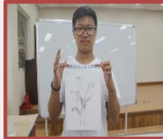
植物细密画 (Botanical Arts) 的教育