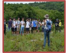
拉姆萨尔条约大严山 龙沼探访