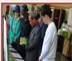
杨口自然环境照片 展示会