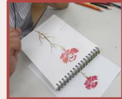
植物细密画 (Botanical Arts) 的教育