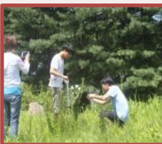
杨口生态植物园体验活动