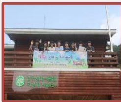
森林体验项目的志愿 者活动