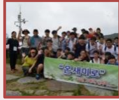
拉姆萨尔条约 大严山龙沼探访