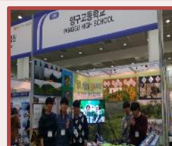
大韩民国教育博览会