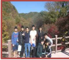
步行前往金刚山的大 会