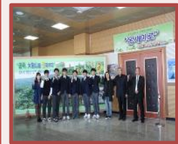
杨口自然环境照片 展示会