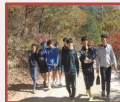
步行前往金刚山的大会