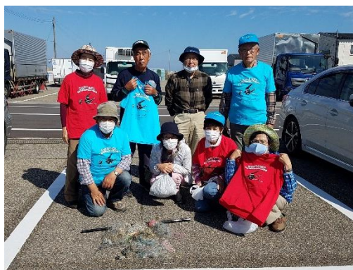
日本鳥類保護連盟富山県支部の皆さん