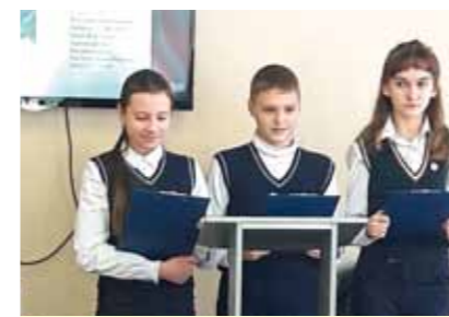
해양 쓰레기 발표