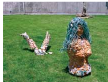
아트 작품 예