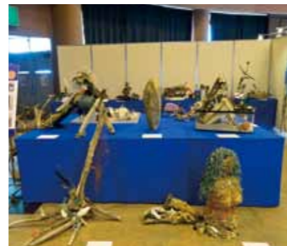
도야마 환경 페어 2016