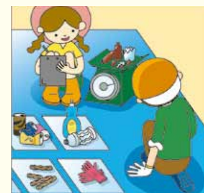
④ 표착물의 종량·개수를 측정하여 표에 기입합니다.