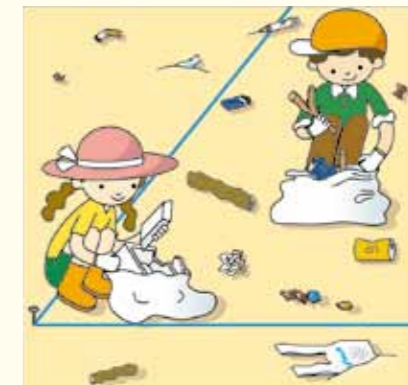
② 표착물을 주워 모읍시다.