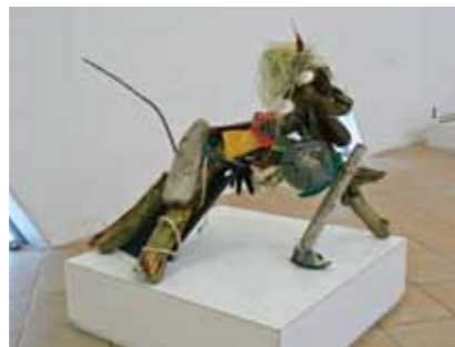
아트 작품 예