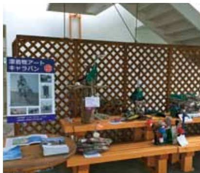
다카오카 오토기노모리 공원