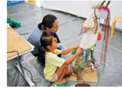
②표착물 아트 제작