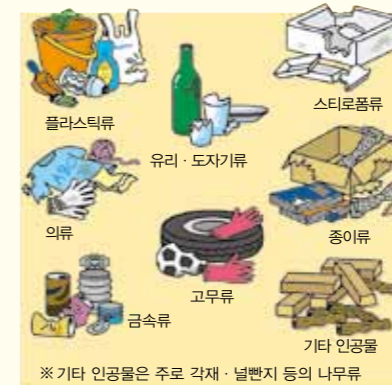
③ 표착물을 분류합니다.