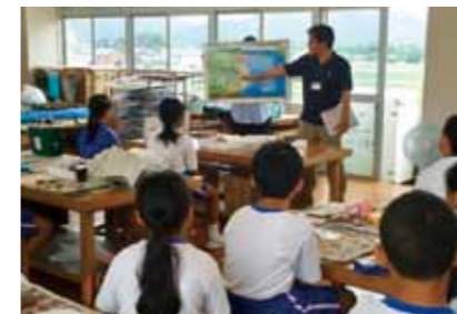
해양 쓰레기 학습