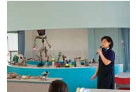
③강사의 작품 평가