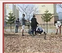
Выращивание школьного леса