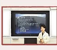
Лекция профессора университета об экологии