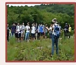
Болотные угодия Рамсарской конвенции