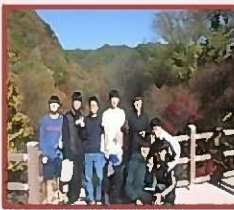
Туристический маршрут по старой горной дороге