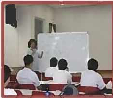
(Botanical Arts) Ботаническое искусство