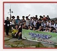
Болотные угодия Рамсарской конвенции