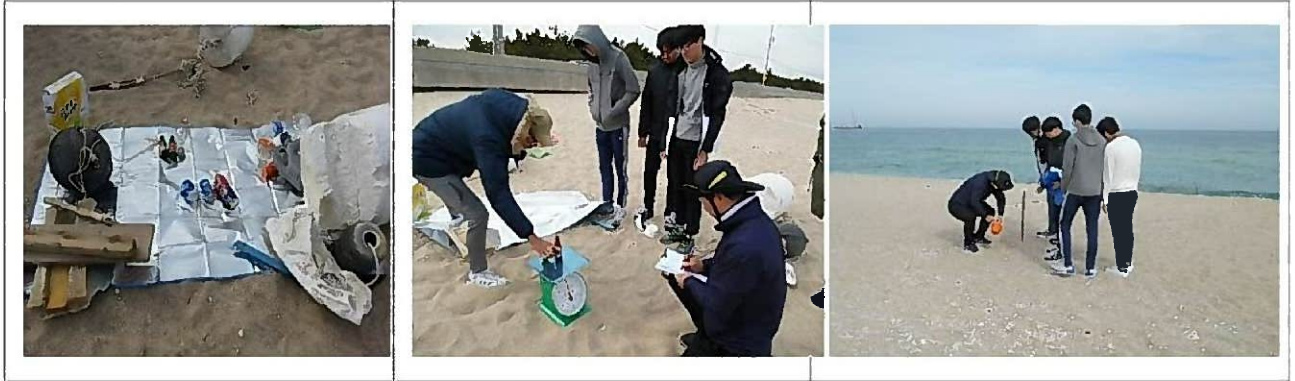
Побережье Чжумунчжин Ёнчжин