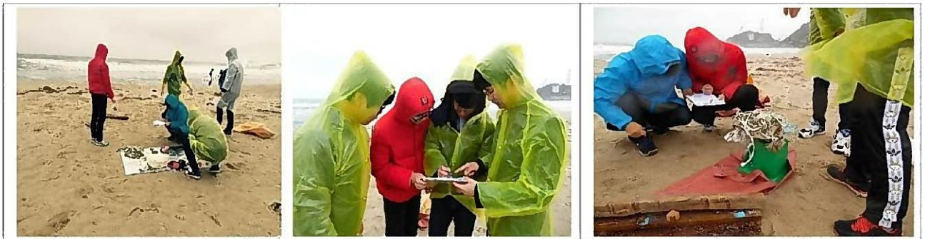
Побережье Янни Хачжодэ