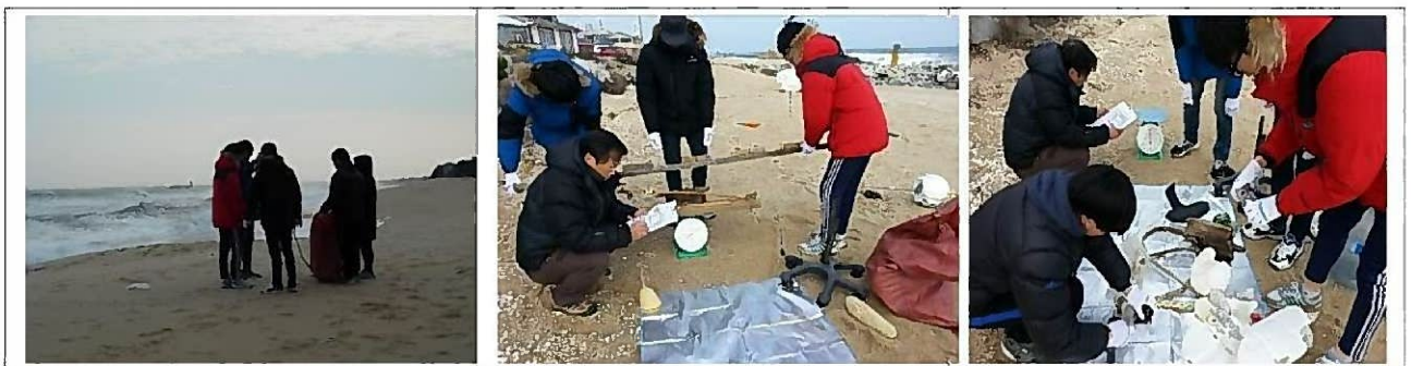
Побережье Каншун Кёнподо