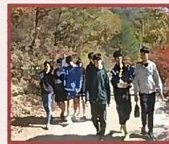
Туристический маршрут по старой горной дороге