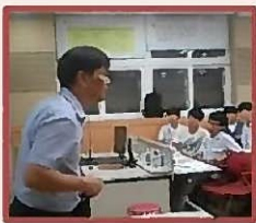
Лекция профессора университета об экологии