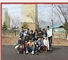
Выращивание школьного леса