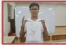
(Botanical Arts) Ботаническое искусство