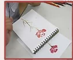
(Botanical Arts) Ботаническое искусство