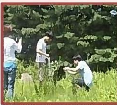
В ботаническом саду Янгу