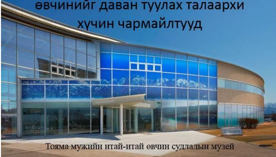
Тояма мужийн итай-итай өвчин судлалын музей