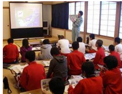
Далайн хог хаягдлын тухай суралах