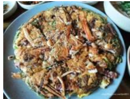
Барьсан хясаагаараа амттай хоол хийж, амталгаа явуулах (5 мэдрэхүйдээ сэтгэл ханахуй)