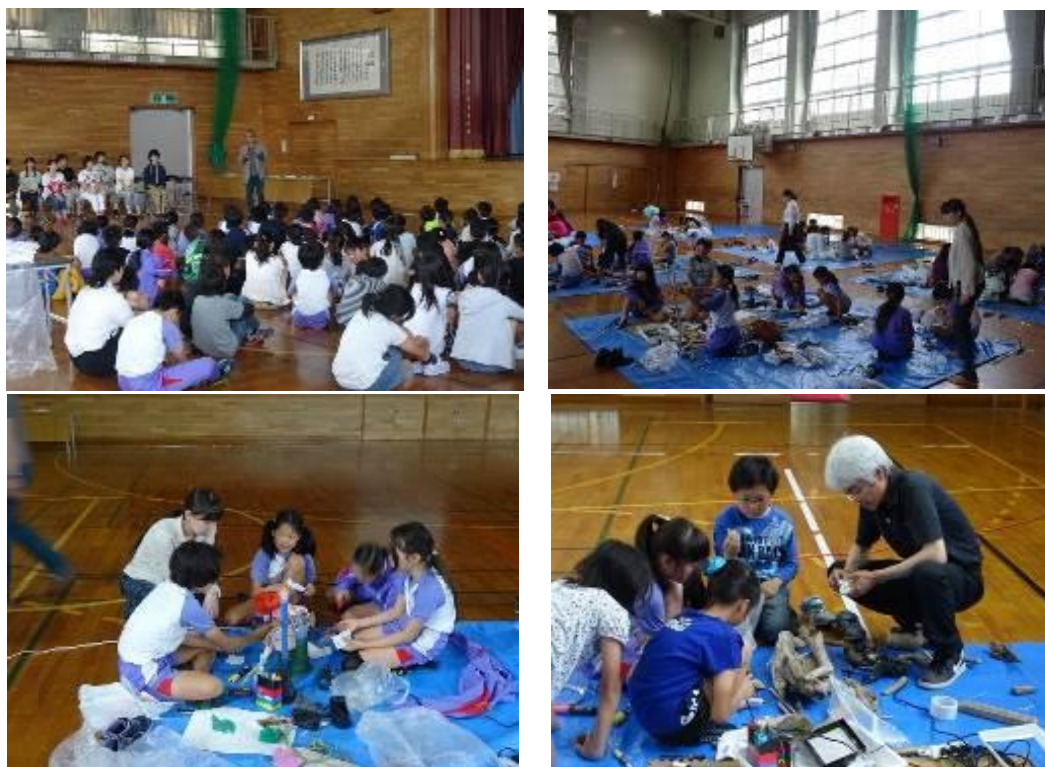
Тояма муж Хэрэгжүүлсэн байдал

(лавлагаа 2016жил д Оролцосон засагийн газар : Тояма муж, Фүкүй муж, Приморийн хязгаар, Хабаровск хязгаар)