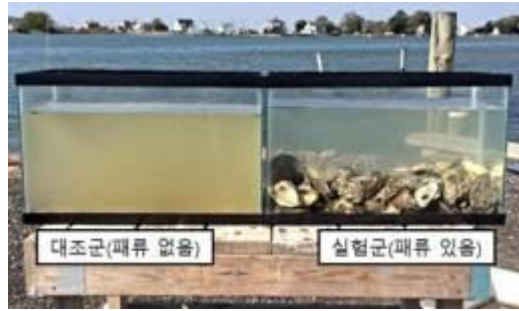
Усны булингарыг хясаагаар цэвэрлүүлэх туршилт