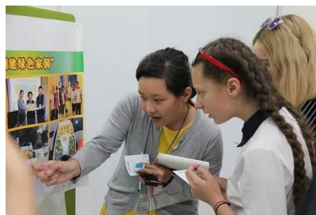
Зурагт хуудас хуралдаан

с. Оролцосон засагийн газар (4улс 9засагийн газар)