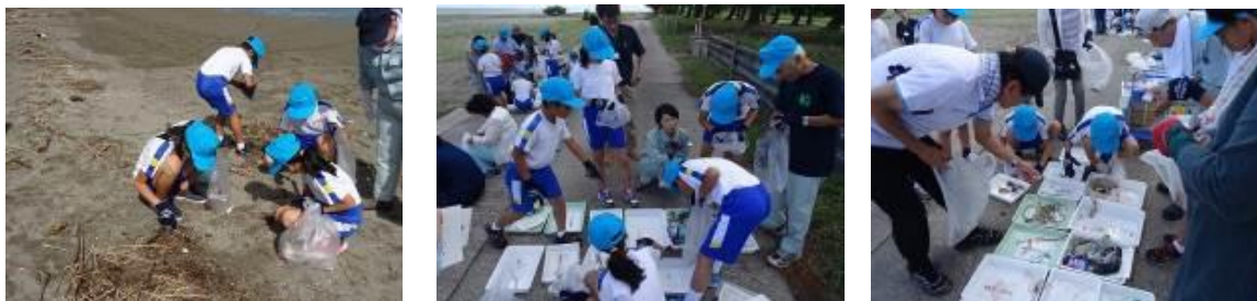
Тояма муж д Хэрэгжүүлсэн байдал

Тоттори муж, Шиманэ муж, Ямагүчй муж, Сага муж, Иагасакй муж, Канвон муж, Чүнчоннам муж, Кёнсаннам муж, Приморийн хязгаар, Хабаровск хязгаар