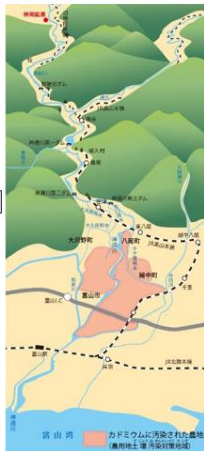
※市町村名は 2005 (平成 17) 年の市町村合併前のものです。