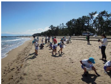
Далайн хөвөөны хөвөмөл будасын байцаалт

(Лавлагаа) Далайн хөвөөны хөвөмөл будасын байцаалт ба хөвөмөл будасын урлаг үйлдвэрлэлийн байдал