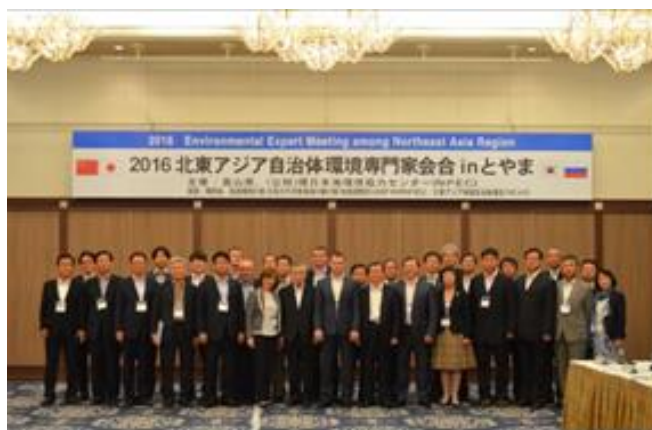
2016 Зүүн Хойд Азийн засаг захиргаа байгаль орчны мэргэжилтнүүд уулзалт inТояма