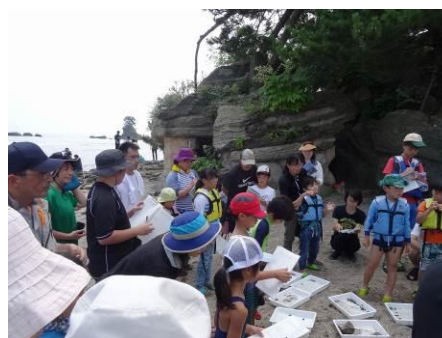
Тояама муж дахь хэрэгжүүлэлтийн байдал