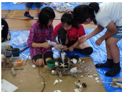
Хөвөмөл будасын урлаг үйлдвэрлэл