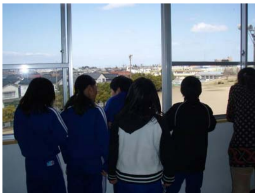
Японы бага сургууль дэх байцаалт

( http://www.npec.or.jp/northeast_asia/ )