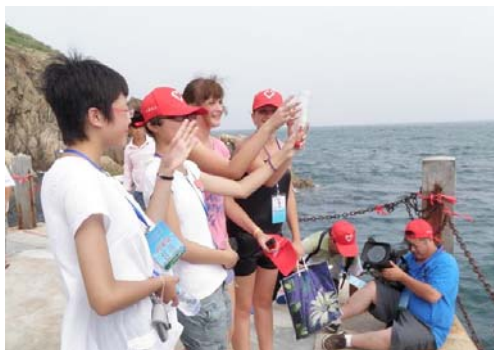
Мэдээ илгээх лонх урсгаах

Бусад : 「2010Дален байгаль орчины тунханлал бичиг」 ний илтгэл хийх