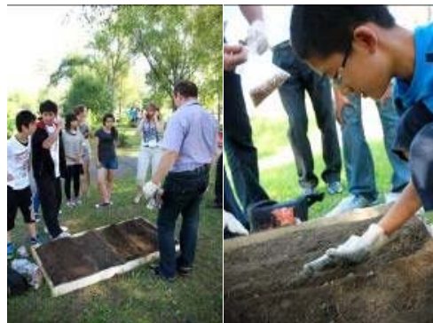
үрийг тарих суулгах дадлага