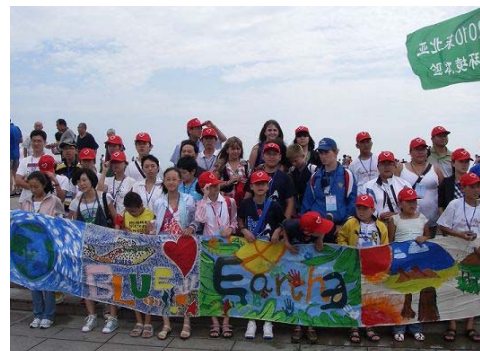
Байгалыг хамгаалах зарлах зураг