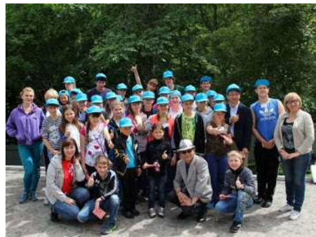
Хабаровск хязгаархөвөмөл будасын урлаг үйлдвэрлэл