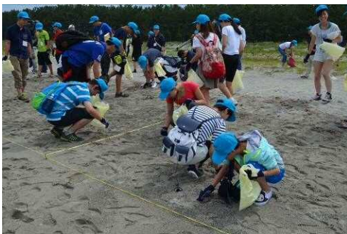
Далайн хөвөөны хөвөмөл будасын байцах дадлага