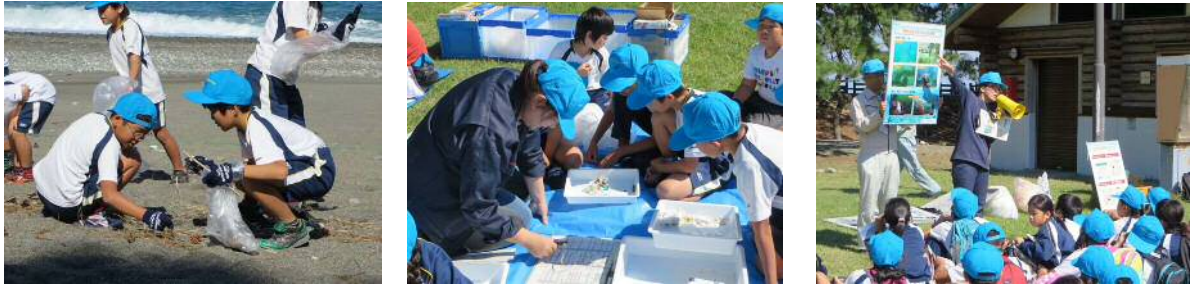
ТоямаАймаг д хэрэгжүүлсэн байдал