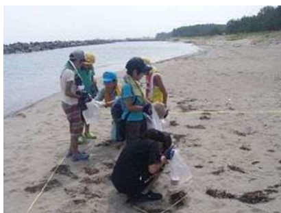
Далайн хөвөөны хөвөмөл будасын байцаалт

※бусад: Зүүн хойд Азийн эрэг хавийн хотын оролцохыг өргөн уриалах.