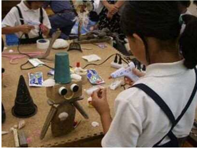
Хөвөмөл будасын урлаг үйлдвэрлэл