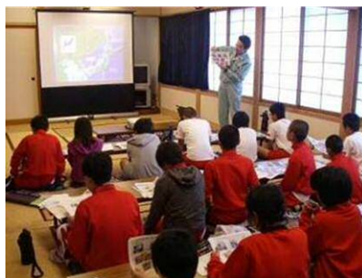
Тэнгисийн хогийн тухай суралцах