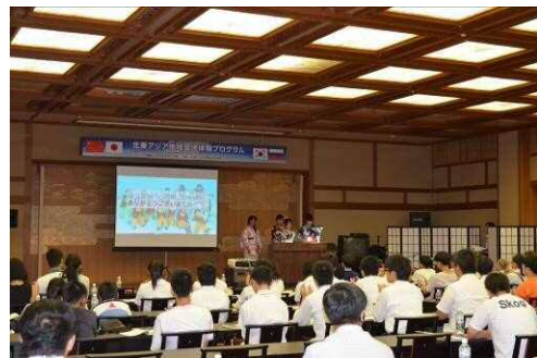
Байгаль орчныг хамгаалах илтгэл