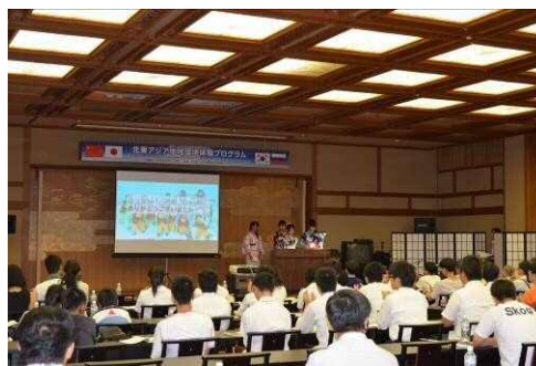
Выступление с докладами