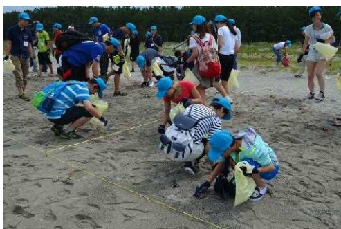
Изучение отходов искусственного происхождения на побережье