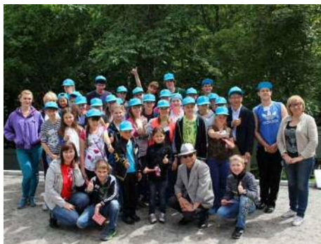
Мастер-класс в Хабаровском крае