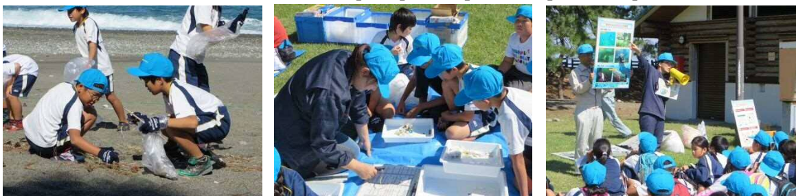
Как проходит изучение в Тояма

Тояма, Ямагата, Исикава, Фукуи, Киото, Хёго, Тоттори, Симанэ, Ямагучи, Сага, Нагасаки, Канвондо, Кёнсаннамдо, Приморский край, Хабаровский край