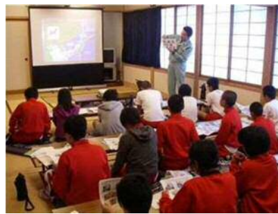
Лекция о морском мусоре