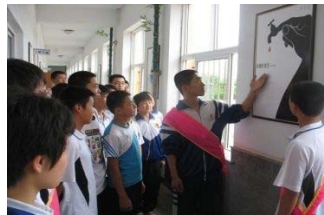
Үйл ажиллагаанд оролцогчын сурталчилгаа