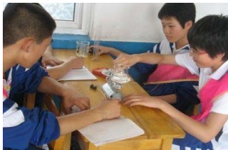
Судалгааны үр дүнгээ гаргаж байгаа нь