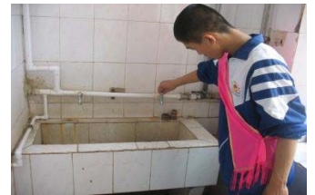
Ус хэмнэх үйл ажиллагаанд оролцогч