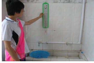
Судалгаа хийж байгаа байдал