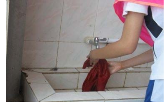
Судалгаа хийж байгаа байдал