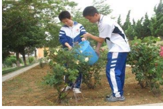
Хэмнэсэн усаараа цэцэг усалж тарих