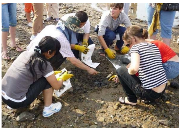
байгаль орчины дадлага 1

⑦бусад 「2008 Таеан байгаль орчины тунханлал бичиг」 ийг сонгох