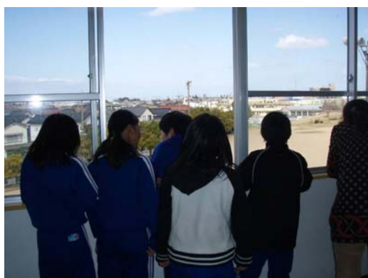
Японы бага сургууль дэх байцаалт

2008 онд, ①Байцаатын тайлбарыг хийх, ②Тояма Аймагаас гадаадын засагийн газарт мэргэжилтэн томилох ба, ③Номераге хийж, 2009оны 3 сараас байцаалт хийх