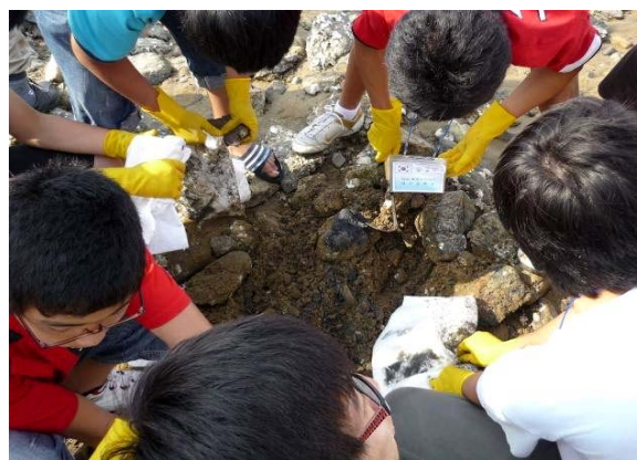
байгаль орчины дадлага 2