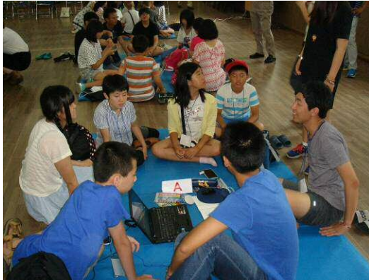
그룹별로 동영상 (환경UCC) 제작