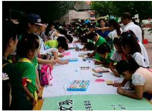
환경보전 PR 현수막 제작,서명