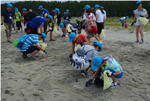
해안 표착물조사 체험