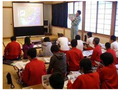
<해양쓰레기 관련 학습>