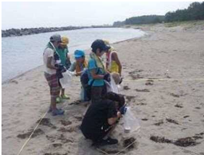
<해안에서 표착물 조사>