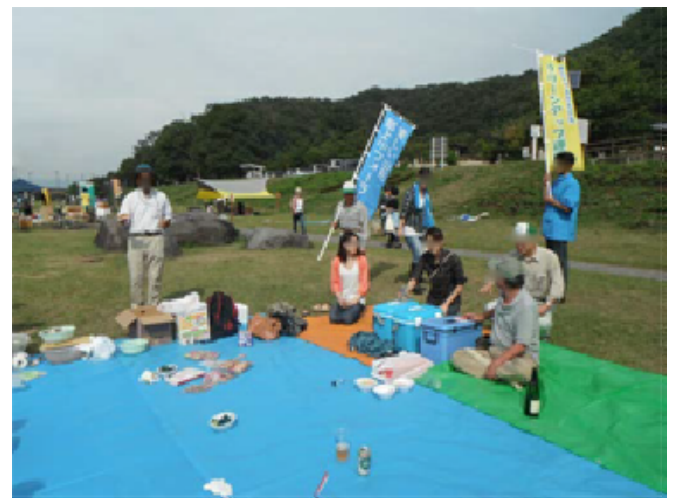
냄비파티 참가자들에게 휴대용티슈를 배부