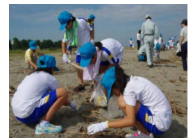
해변의 표착물 조사

NEAR 의 조직을 통해 한국,일본,중국,러시아의 연안자치단체와 연계해서 해변의 표착물조사나 황사의 시정조사를 실시했으며, 우호제휴 지방인 랴오닝성과 공동환경조사를 실시하는 등 환경보전 활동을 추진하고 있습니다.