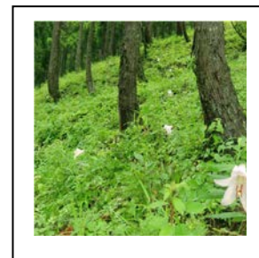
○백합이 피는 숲만들기