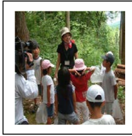
○숲과 인간의 관계