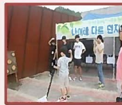
森林体验项目的志愿 者活动