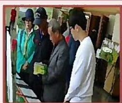
杨口自然环境照片 展示会