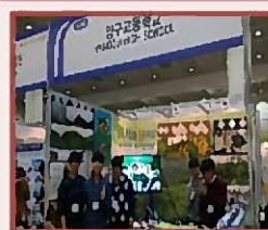
大韩民国教育博览会