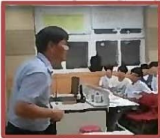
大学教授召开的生态 环境讲座