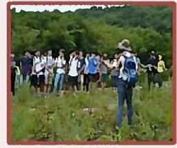
拉姆萨尔条约大严山 龙沼探访