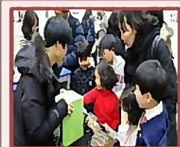
大韩民国教育博览会