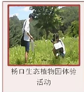
杨口生态植物园体验活动