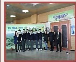
杨口自然环境照片 展示会