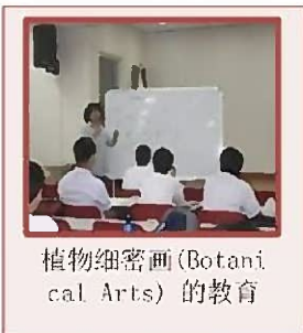
植物细密画(Botanical Arts)的教育