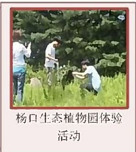
杨口生态植物园体验活动