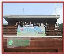
森林体验项目的志愿 者活动