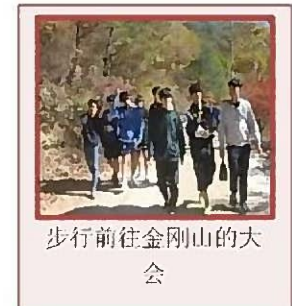
步行前往金刚山的大会