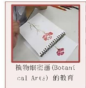
植物细密画(Botanical Arts)的教育