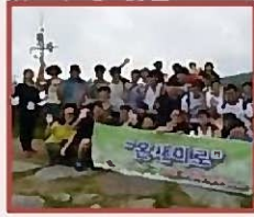
拉姆萨尔条约 大严山龙沼探访