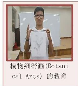
植物细密画(Botanical Arts)的教育