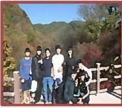
步行前往金刚山的大 会