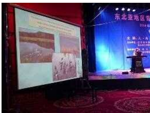
环境保护的活动发表