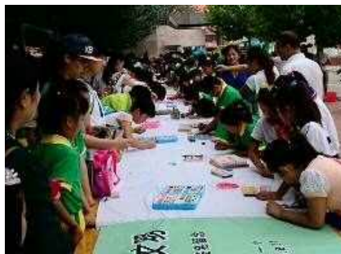
环境保护宣传横幅的制作贺签名

c 参加自治团体 辽宁省、北京市、黑龙江省、江原道、忠清南道、庆尚南道、哈巴罗夫斯克地区、滨海边疆州、富山县