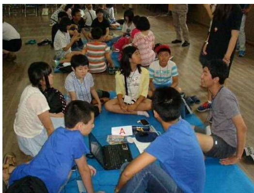
分组制作动画（环境 U C C）