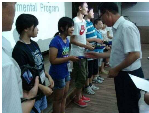
优秀作品表彰仪式