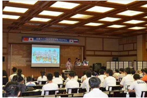
环境保护活动报告

c 参加自治团体 辽宁省、黑龙江省、江原道、忠清南道、庆尚南道、 滨海边疆州、哈巴罗夫斯克地方、山形县、富山县