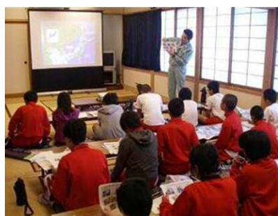
<关于海洋垃圾的学习>