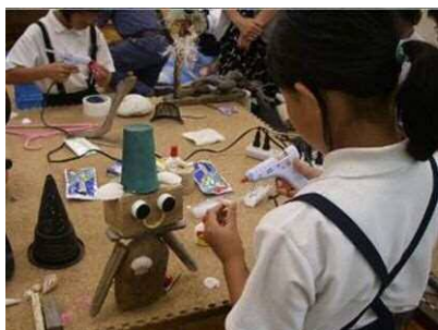
<漂浮物艺术作品制作>