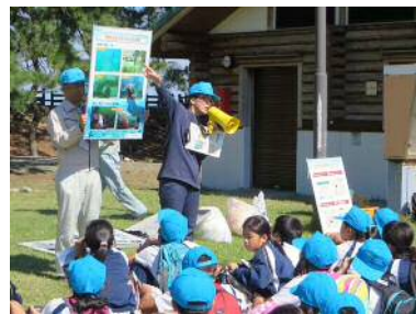
富山县的开展情况