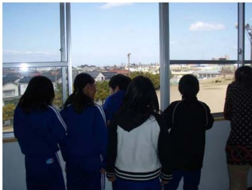
日本小学里的调查情景

在 2008 年度，以设计统一的监测手法和向各国自治团体进行技术转移为目的，①制定调查指南②从富山县向海外自治团体派出专家（进行现场说明并做各种调整）③开设主页（公布调查指南），并从 2009 年 3 月同时开始了调查。