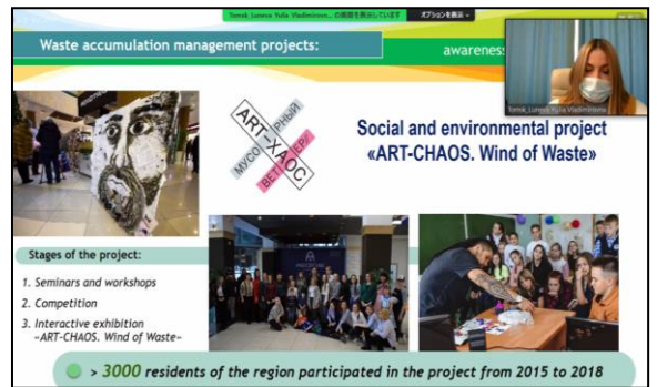
Томск мужийн илтгэл