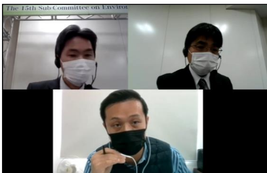
Мэдээлэл солилцож буй нь