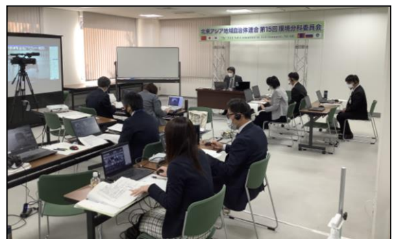
Байгаль орчны хорооны хурал зохион байгуулагч тал

* Зүүн Хойд Азийн орон нутгийн засаг захиргааны байгууллагуудын байгаль орчны мэргэжилтнүүдийн хурлаас гаргасан 2016 оны Тояамагийн тунхаглалын тухай (2016 оны Тояамагийн тунхаглал)