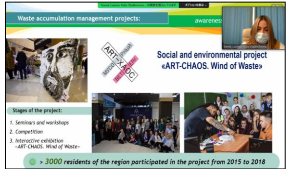
러시아 톱스크주 사례발표