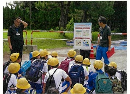
漂浮物调查活动 (富山县)