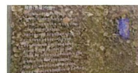
<参观先史时代的贝冢(蓝碳储备)>