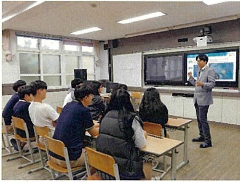
蓝碳理论教育学习