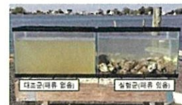
<使用牡蛎净化水质的实验>