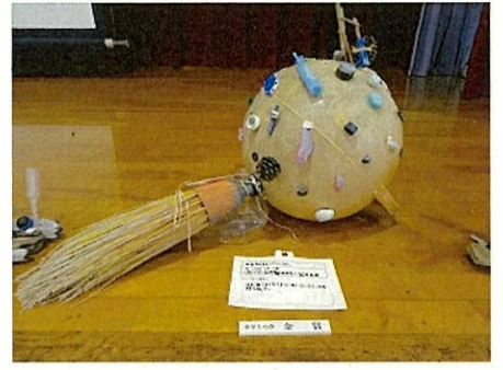
漂浮物艺术作品制作 (富山县)