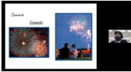
도야마현 (국제대 부속고교)